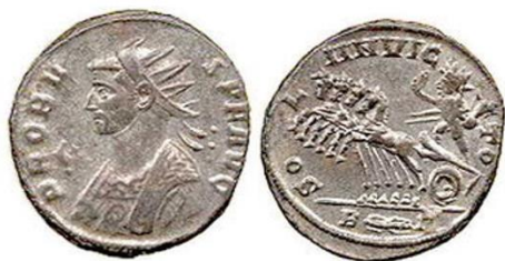
Moneda del emperador Probo, con la inscripción, soli invicto , “al sol invicto”.